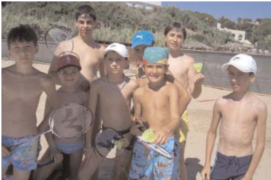
Sopra e sotto i giovanissimi giocatori; in basso le tedesche