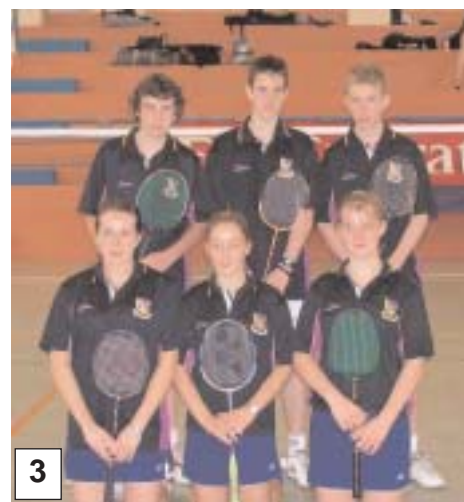
1° foto Whiteabbey Badminton Club - 2° foto Birkirkara Badminton Club - 3° foto Wexford Badminton Club