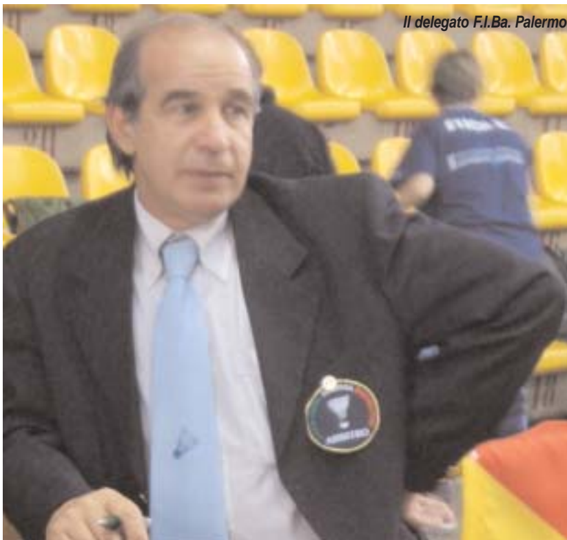
Il delegato F.I.Ba. Palermo

tagliando compilato, spedendolo a uno dei seguenti indirizzi: comunicazioni con la redazione 339 2609115 redazione.amatoribad@tiscali.it - fax 095 338121